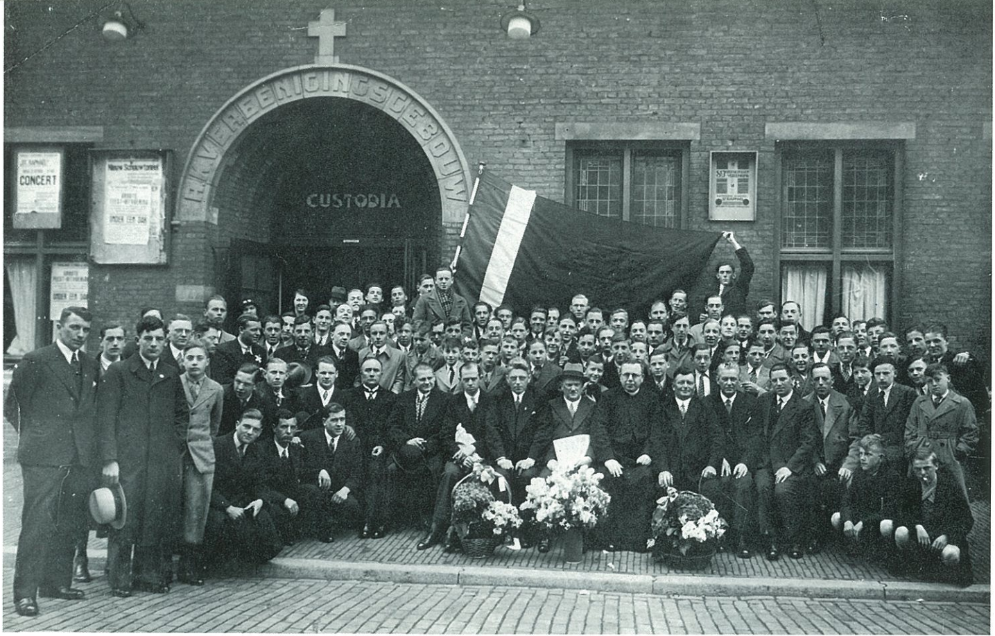
... de eerste ...

Als we terug gaan naar de historie zien we dat het seizoen 1932-1933 weer twee kampioenen geeft en wel het tweede elftal en . . . . wederom het B-elftal. Ondanks voetbalvoorspoed bleven er voor de jonge vereniging problemen. Wie zou het verlossende woord spreken in het vraagstuk of het (tegen de achtergrond van de Heiliging van de Dag des Heeren) verantwoord was zondagen, waarop geen competitiewedstrijden waren vastgesteld, te besteden aan vriendschappelijke wedstrijden. De annalen vermelden niet hoe in dit probleem werd voorzien, maar het is in elk geval door de tijd achterhaald.