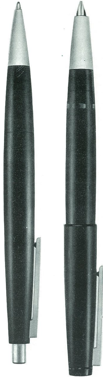
Vulpenhouder Hfl. 65.— Ballpoint Hfl. 29,50